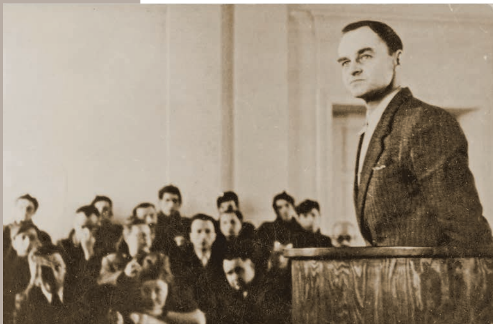
Witold Pilecki podczas składania wyjaśnień przed Wojskowym Sądem Rejonowym w Warszawie, marzec 1948 r.

skutek powstania 1863 r. dziada mego przez rząd carski do Syberii i konfiskacie majątku z pozostałej ziemi po linii żeńskiej po podziałach pozostało mi w udziale 37½ ha ziemi ornej z łąkami. Nie poprzestałem na pracy na roli, lecz poszedłem w budzenie mas ludowych. Zorganizowałem i prowadziłem Kółko Rolnicze, Ochotniczą Straż Pożarną i Spółdzielnię Mleczarską przez 12 lat (wieś Krupa k. Lidy). Zorganizowałem i prowadziłem Przystosowanie Wojskowe Konne pow. lidzkiego przez 7 lat. W stopniu podporucznika rezerwy z tym oddziałem [...] poszedłem na front sierpień 1939 r. Od tej chwili wykonywałem rozkazy starszych ode mnie stopniem oficerów polskich, dowódców jednostek polskich, do których przydzielony byłem rozkazem. Po rozbiciu pod Piotrkowem – na rozkaz gen. Piekarskiego organizuję we Włodawie 13–16 IX 1939 r. oddział 41 Dywizji Piechoty, z którym po rozbiciu dywizji trwam w lasach do 17 X 1939 r., niszcząc 7 czołgów, dwa samoloty na lotnisku prowizorycznym i jednego samolotu w powietrzu (niemieckich). Widząc nikłość rezultatów tego rodzaju walki z Niemcami, przestawiam się na inną i dn. 2 XI 1939 r. z kolegami przemianowujemy w Warszawie ten oddział na Tajną Armię Polską, w której początkowo pracuję na stanowisku szefa sztabu, następnie inspektora głównego TAP. Z chwilą ujawnienia przez płk. Roweckiego »Grota« upoważnienia gen. Sikorskiego