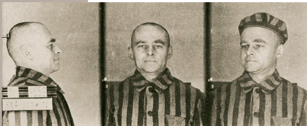
Witold Pilecki jako Tomasz Serafiński, więzień KL Auschwitz nr 4859

podczas łapanki na warszawskim Żoliborzu pozwolił się aresztować jako Tomasz Serafiński. Do Auschwitz dotarł wraz z 1705 osobami w nocy z 21 na 22 września 1940 r. tzw. drugim transportem warszawskim. Otrzymał numer obozowy 4859.