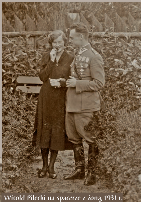
Witold Pilecki na spacerze z żoną, 1931 r.