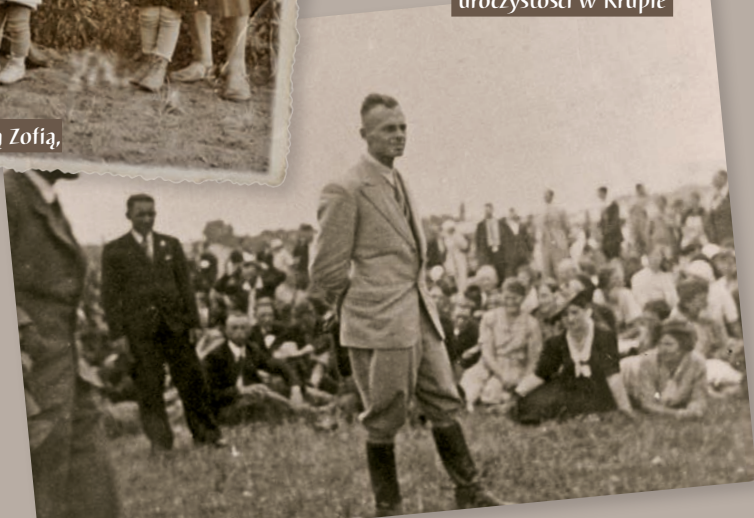
Witold Pilecki, właściciel majątku Sukurcze, podczas uroczystości w Krupie