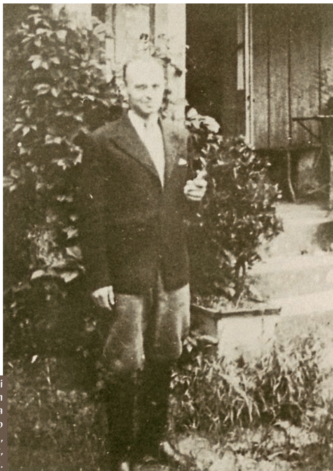
Por. Witold Pilecki przed dworem Koryznówka (dom prawdziwego Tomasza Serafińskiego), Nowy Wiśnicz, lato 1943 r.

Na wolności tak podsumował swój pobyt w Auschwitz: „wychodząc miałem o kilka zębów mniej niż w momencie mojego tu przyjazdu i złamany mostek, zapłaciłem więc bardzo tanio za taki okres czasu pobytu w tym sanatorium”.