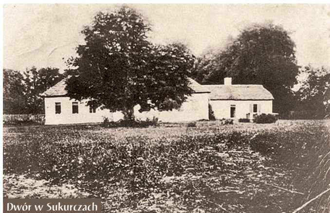
Dwór w Sukurczach