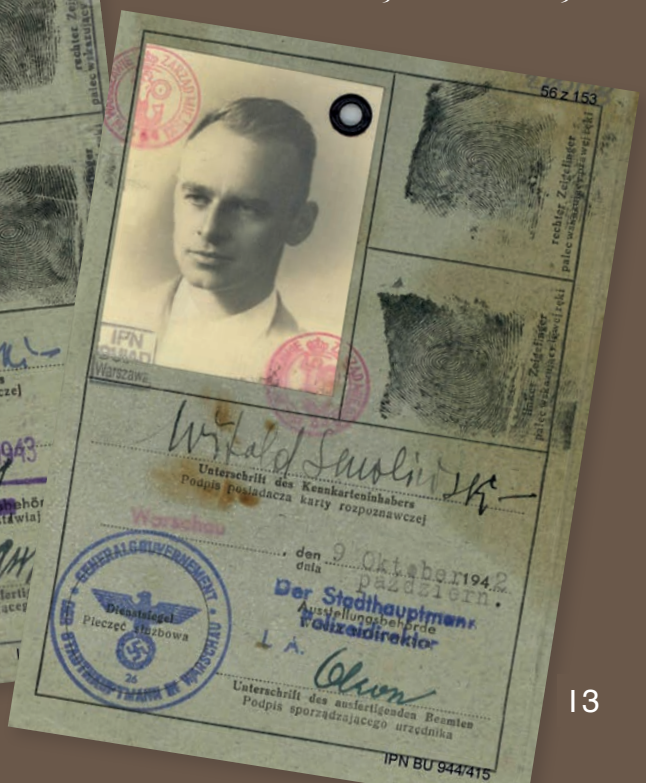
Kenkarty Witolda Pileckiego