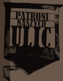
Rotmistrz Witold Pilecki (1901–1948)