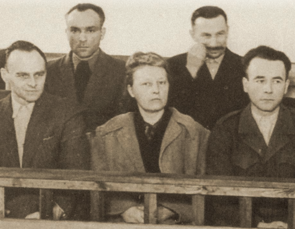
Grupa Witolda Pileckiego na ławie oskarżonych, marzec 1948 r.