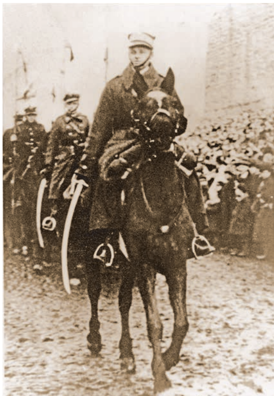
Witold Pilecki prowadzi w Lidzie defiladę z okazji Święta Niepodległości

Poza pracą w majątku Witold Pilecki rozwijał wówczas także działalność społeczną. Był naczelnikiem Ochotniczej Straży Pożarnej, prezesem mleczarni, z której masło było sprzedawane aż w Wilnie, z miejscowymi rolnikami założył kółko rolnicze, pomagał także ludziom w potrzebie. W kwietniu 1932 r. zorganizował w powiecie lidzkim Przystosowanie Wojskowe Konie (krakusów), które w 1937 r. zostało podporządkowane 19. Dywizji Piechoty. W 1937 r. za swoje zaangażowanie w sprawy publiczne otrzymał Srebrny Krzyż Zasługi. Pomimo wielu zajęć znajdował również czas na pisanie wierszy i malarstwo. Do dziś w kościele parafialnym w Krupie, w którego budowie uczestniczył, zachowały się dwa namalowane przez niego obrazy.