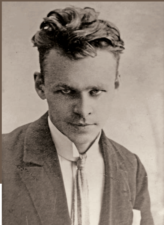
Witold Pilecki, uczeń Gimnazjum im. Joachima Lelewela w Wilnie, 1919 r.