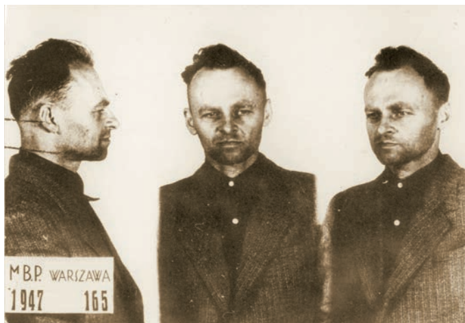
Witold Pilecki jako więzień MBP nr 165, 1947 r.